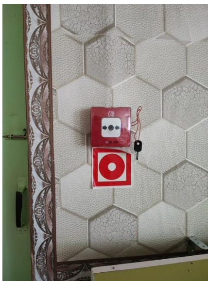
Фото знака F10 с пожарным извещателем.