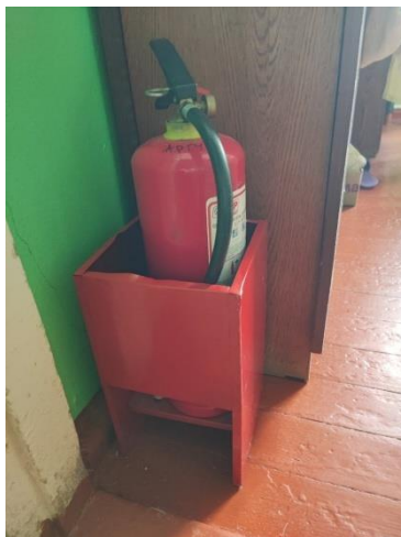
Фото подставок для огнетушителей.