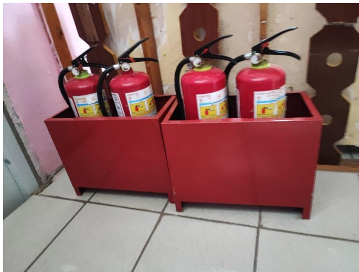
Фото подставок для огнетушителей.