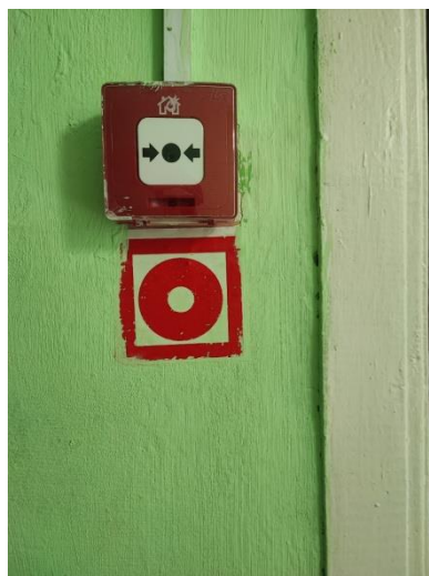
Фото знака F10 с пожарным извещателем.