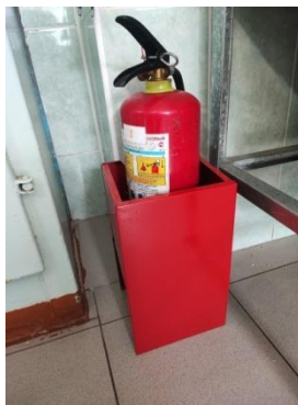
Фото подставок для огнетушителей.